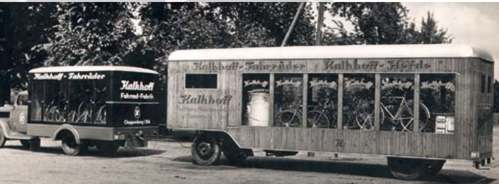
Präsentations-Mobil samt verglastem Anhänger (darin auch zu sehen: Kocher und Herd) • 1952: Klassischer Herren-Tourer ....

Sogar die Kettenradgarnituren wurden selbst gestanzt und in der eigenen Galvanik veredelt). Damals erreichte die Tagesproduktion 5000 Rahmen! Sogar Mopeds und Mofas waren im Angebot. Wobei der Export von Rädern und Teilen von besonderer Bedeutung war: Das lukrative Geschäft ermöglichte dem Unternehmer eine Expansion: 1955 entstand ein Zweitwerk in Volkmarshausen, wo man ausschließlich für den Export nach Südafrika und Übersee produzierte.