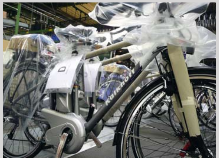
... bevor die Räder gut verpackt in den Versand – und damit in alle Welt – gehen.