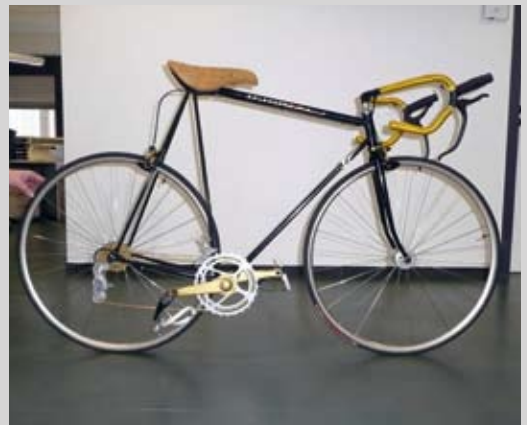
... in „schlagfester Kalkhoff-Emaille auf rostgeschütztem Untergrund“ • Spezielles: 1 von 12 Klapprädern speziell für Mercedes, darunter: Kalkhoff-Bahnrad vom Designer Collani

Ungewöhnliche Werbung war Kennzeichen von Kalkhoff. Es gab viele Werbemotive, auf denen Apo-Ikone Uschi Obermeier freizügig für Kalkhoff-Räder posierte.